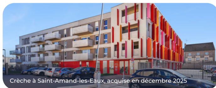
Crèche à Saint-Amand-les-Eaux, acquise en décembre 2025